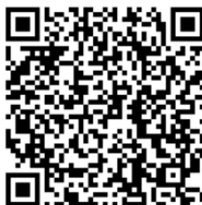
Рисунок 4 — Сценарий для проведения дебатов «Идеология радикализма»

Первая команда всегда будет представлять сторону радикальной идеологии. Задача команды студентов – найти контраргументы тех радикальных и спорных тезисов, которые будет озвучивать первая команда. Тем самым, участники будут вынуждены критически рассматривать постулаты радикальных идеологий, искать в них логические ошибки, несоответствия – самостоятельно приходиться к выводу о деструктивности любой радикальной идеологии (см. рисунок 4).